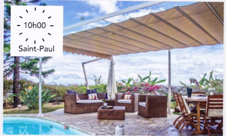
- 10h00 - Saint-Paul