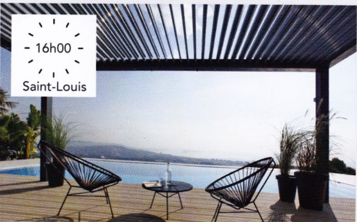
- 16h00 - Saint-Louis