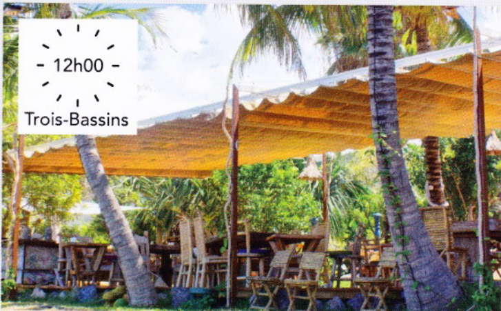
- 12h00 - Trois-Bassins