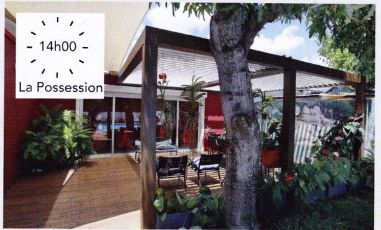
- 14h00 - La Possession