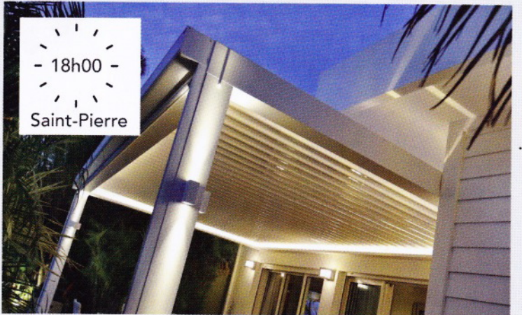
- 18h00 - Saint-Pierre