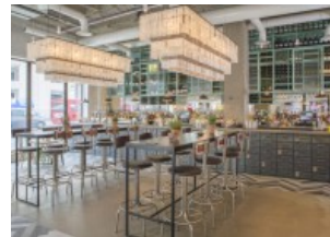
LONDON LONDON: ST. PAUL'S CATHEDRAL BEKOMMT NEUEN NACHBARN