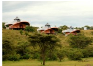
AFRIKA KENIA: RICHARD BRANSON ERÖFFNET SAFARI- WELTRAUM-LODGE