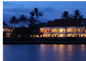
ASIEN "FRIEDLICHER TREFFPUNKT" ERÖFFNET IN VIETNAM