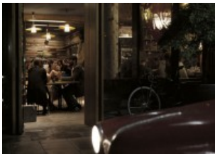
AUSTRALIEN/NEUSEELAND NACHHALTIG WOHNEN IN CANBERRA