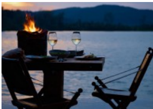
ASIEN AUF SONG SAA GEHT DIE LIEBE DURCH DEN MAGEN