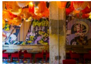
BARCELONA BARCELONA: JUGENDHERBERGE IST DESIGN-HOTSPOT