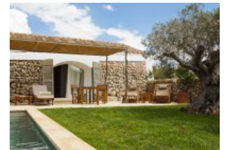
SPANIEN MENORCA: URLAUBEN AM LUXUSBAUERNHOF